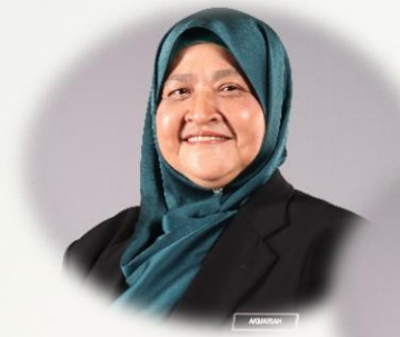
KU & UNIT PIM