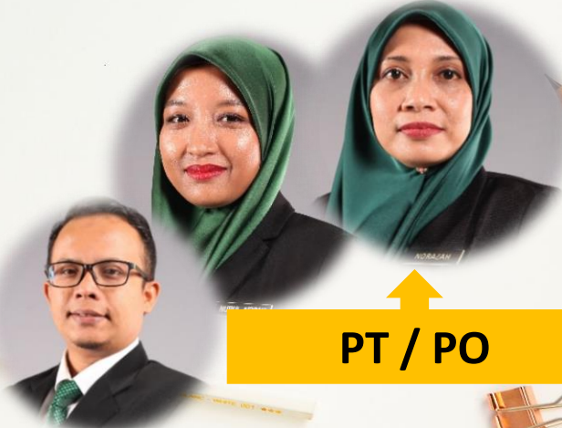
PT / PO