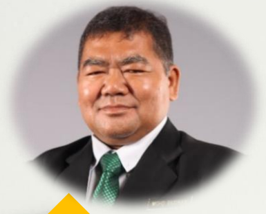
KU & UNIT PAM