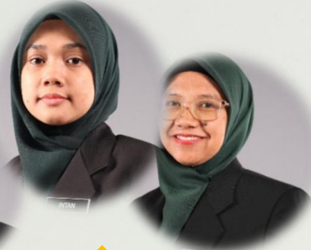
PTM & UNIT ICT