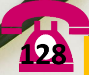
BILIK PENSYARAH 1 FIZIK