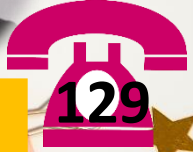
BILIK PENSYARAH 1 MATEMATIK