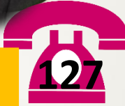
BILIK PENSYARAH 1 KIMIA