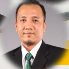
PT / PO