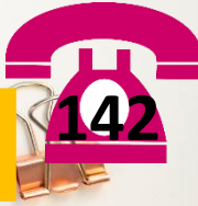
KPM & MAKMAL KIMIA