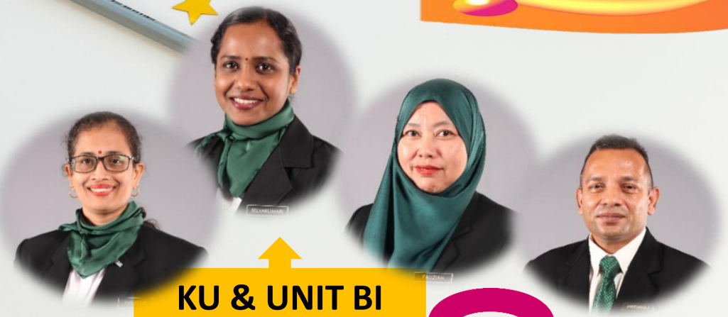
KU & UNIT BI