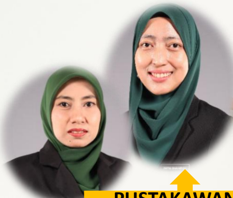
PUSTAKAWAN & UNIT PDO