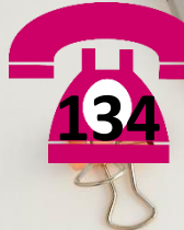
KPA & UNIT ASRAMA