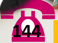
PJ & UNIT TEKNIKAL