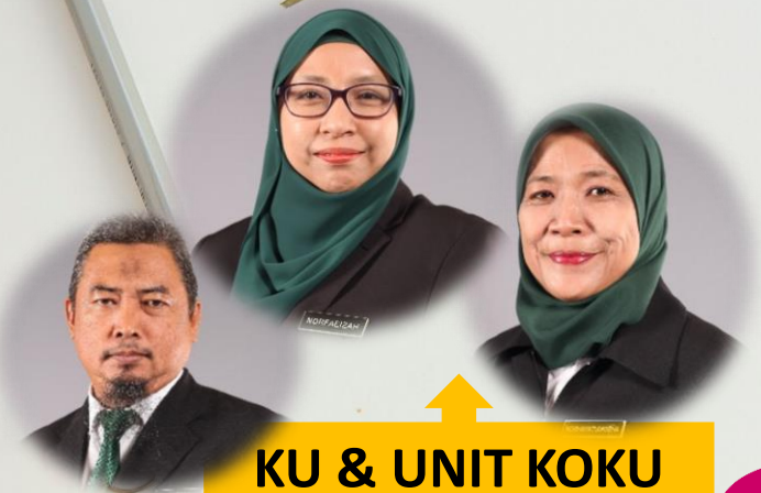
KU & UNIT KOKU