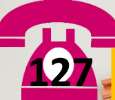
BILIK PENSYARAH 1 KEJURUTERAAN